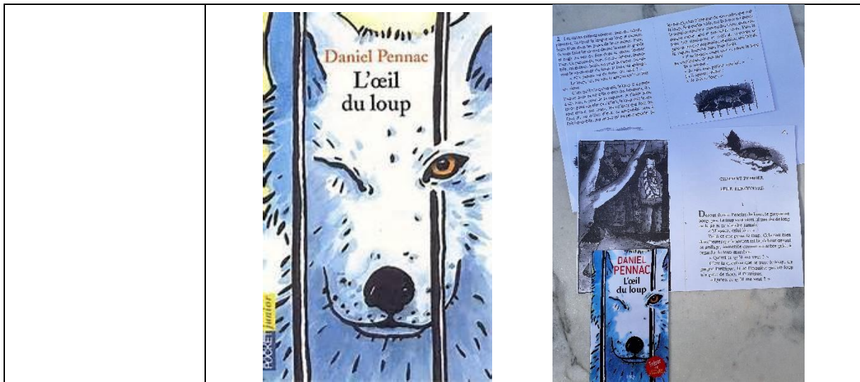
L'ŒIL DU LOUP Daniel Pennac